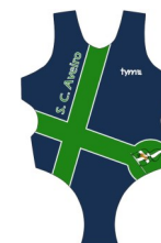
Fato de banho