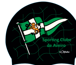
Touca Oficial Competição